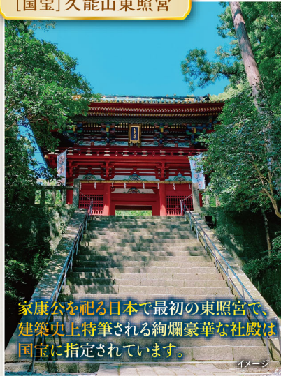
[国宝]久能山東照宮

家康公を祀る日本で最初の東照宮で、建築史上特筆される絢爛豪華な社殿は国宝に指定されています。