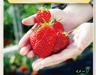
江間いちご狩りセンター