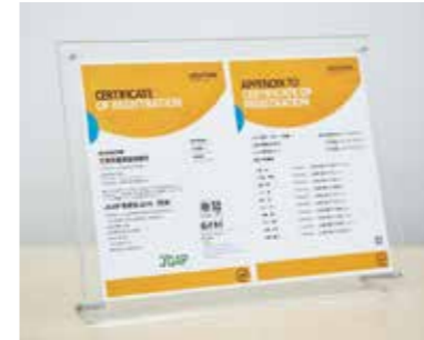
JGAP 青果物2016 (団体) / 認定証