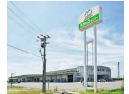
JAてんどう/ラ・フランスセンター