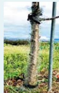
木や金網を設置した様子

●苗木や定植後の年数が短い幼木は、積雪前に金網や合成樹脂のプロテクターなどの資材を地上約1mまで巻きつけて、保護しましょう。