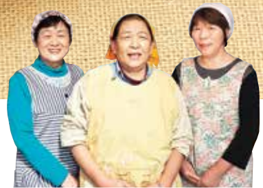
JAてんどう女性部 天童支部